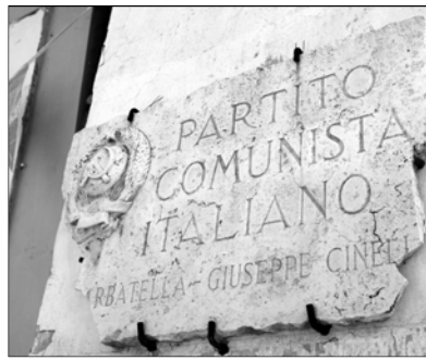
La targa della sezione PCI della Garbatella "Giuseppe Cinelli"

La parte del leone alla Garbatella la fece il Partito comunista che, come abbiamo detto, si impossessò dell'ex Casa del Fascio rionale a Via Passino, un vecchio fabbricato di campagna, preesistente alla costruzione del quartiere, che disponeva di un utilissimo giardino tutt'intorno,