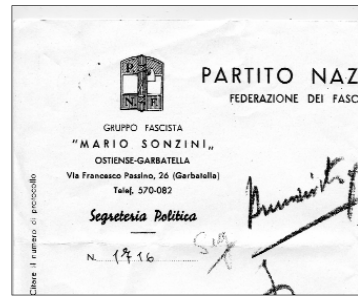
La carta intestata del gruppo rionale fascista della Garbatella

La sezione della "Villetta" in seguito fu intitolata a Giuseppe Cinelli, comunista della Garbatella martire delle Fosse Ardeatine, dove aveva trovato la morte insieme al fratello maggiore Francesco.