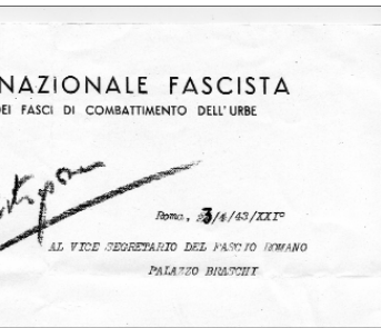
Garbatella di Via Francesco Passino 26