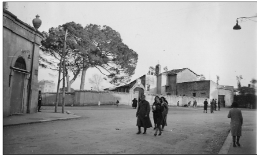
Piazza Sant' Eusebia in una foto del 1945