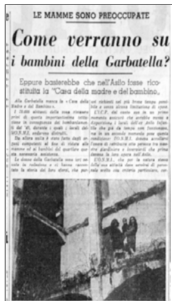
Sull'Unità del '47 un articolo che invoca la riapertura della Maternità del lotto 41

Nei giorni precedenti i partiti di sinistra avevano chiamato i cittadini ad una serie di commemorazioni. Sul Lungotevere Arnaldo da Brescia Giuseppe Di Vittorio ricordò l'uccisione di Giacomo Matteotti e Pietro Nenni intervenne alla fine della cerimonia religiosa in memoria dei fuci-