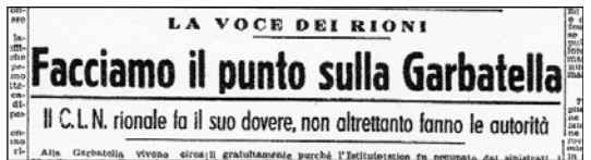
L'Unità del '45: riprende la vita nel nostro quartiere

"Nel mese di luglio - si legge nel Bollettino della Federazione provinciale di Roma 'Vita di partito' - le attività delle sezioni sono state principalmente: l'inquadramento e la costruzione delle cellule, le riunioni di cellula in cui si sono lette e commentate circolari e disposizioni della Federazione, tesseramento, conferenze varie (tra cui quelle di commento a Togliatti), elezione dei comitati di sezione e di cellula, inchieste varie riguardanti l'epurazione e la borsa nera. Notevole sviluppo ha avuto l'attività assistenziale con l'istituzione di uno spazio per la vendita di derrate alimentari e con l'avviamento di pratiche per la concessione di alloggi agli sfollati e ai sinistrati. Col concorso della Ps si sono inoltre sequestrate e cedute al pubblico a prezzi equi notevoli quantità di vino".