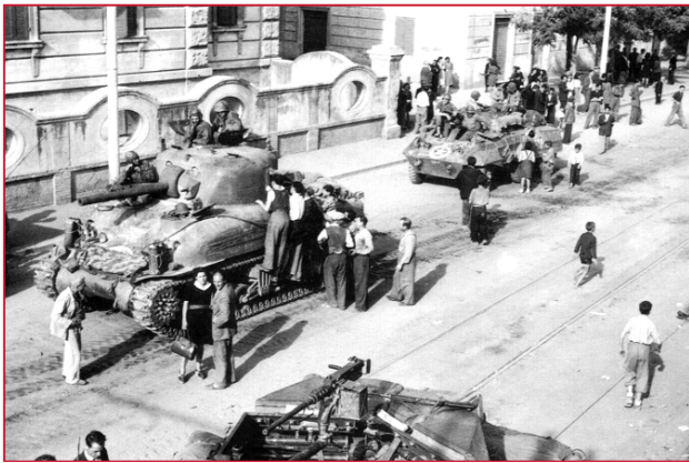
Carri armati alleati il giorno della liberazione di Roma.

Le vicende sul Commissariato PS di Via Percoto sono state descritte anche nella relazione di scioglimento della VII zona del PCI dal commissario politico Giovanni Valdarchi, secondo il quale i patrioti avrebbero difeso il posto di polizia dal saccheggio dei tedeschi, che cercavano armi e denari li depositati. Sicuramente nelle settimane seguenti il 4 giugno, gruppi di partigiani del CLN furono assegnati ai commissariati per vigilare su possibili vendite personali nei confronti di fascisti o collaborazionisti. Inoltre questi patrioti, che si riconoscevano da un bracciale tricolore con la scritta CLN, erano impiegati per operazioni di ordine pubblico per limitare in quei momenti di grande confusione vandalismi e furti nel quartiere. Alla Garbatella, le cronache non rilevano rappresaglie nei confronti di fascisti, ma solo fermi e arresti nei confronti di speculatori e borsari neri.