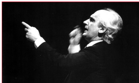
Il maestro Pradella dirige l'orchestra "Alessandro Scarlatti" della RAI di Napoli

con l'ultimo scaglione, ma grazie alla baluzie (ora passata) e ad un amico dottore che vive nel suo stesso lotto finisce in "segregazione" con i cosiddetti malati di mente. Esperienza, questa, a quanto pare non meno dura.